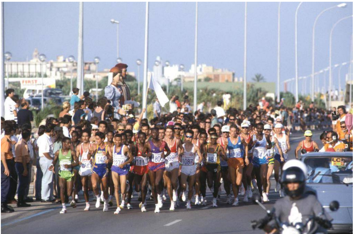
Sortida de la marató Barcelona 92- Mataró