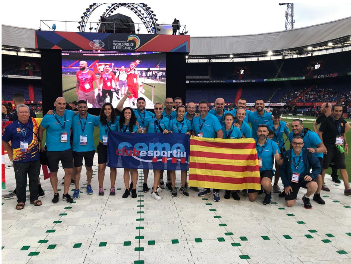
Part de la Delegació Oficial del Cos de Mossos d'Esquadra en la Cerimònia inaugural.