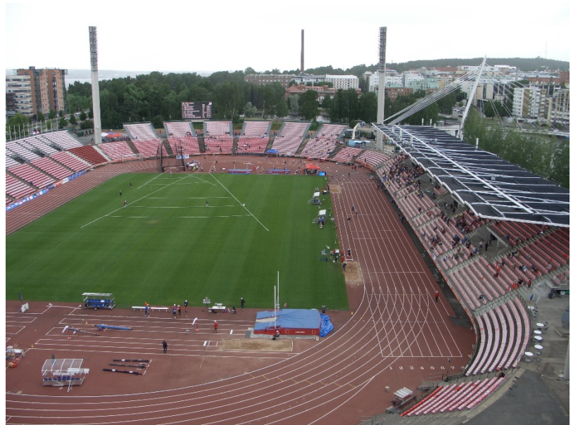
Vista panoràmica des de el "Periscope" (amb l'Estadi just a sota).