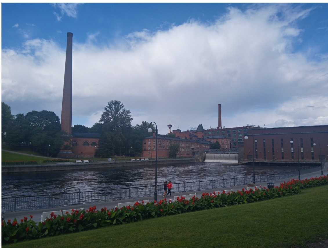
Canal de connexió entre els 2 llacs de Tampere (al fons, indústries característiques).

És força curiós com la ciutat de Tampere encara conserva el vell Estadi atlètic. Graderia totalment de fusta (avui en dia, no crec que s'autoritzi a fer-se pel risc d'incendi) i que el dia que hi vàrem anar, estaven uns operaris fent un repintat. Cal conservar-lo, perquè aquest Estadi és una relíquia. Aquí es han batut fins a 5 rècords del món, com per exemple el dels 2.000 a càrrec d'una figura llegendària com en Paavo Nurmi (5'26"3) fets exactament fa cent anys (1922). També s'ha batut aquí el de la javelina (71,70) a càrrec de Matti Järvinen en 1930, just un parell d'anys abans de proclamar-se campió olímpic a Los Angeles (1932). Una placa a dins el recinte, enumera tots aquests rècords. La cosa curiosa del cas és que l'anella té l'atípic perímetre de 350 metres.