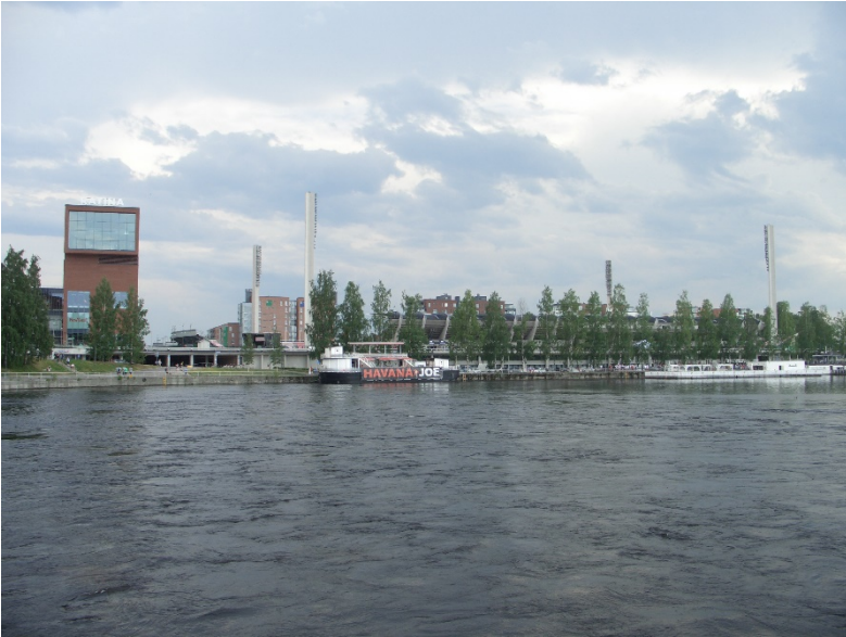
Llac de Pyhäjärvi (al fons, centre comercial Ratina i Estadi del mateix nom).