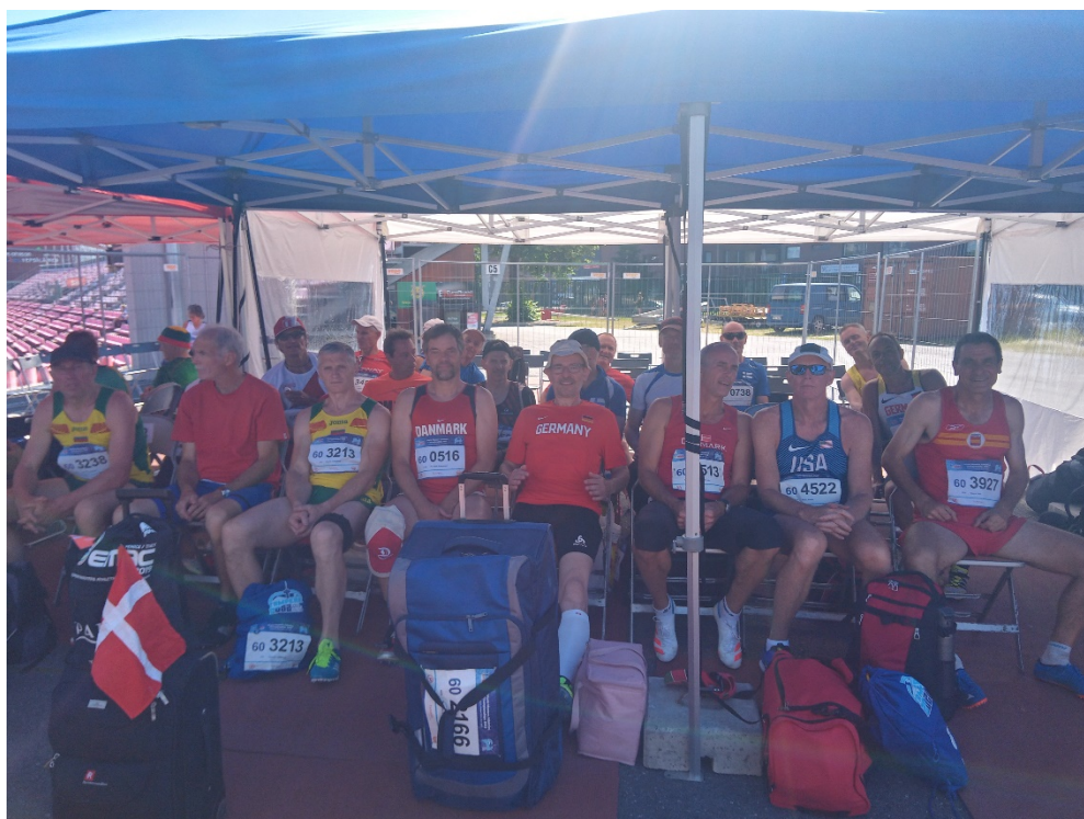
Atletes decatlló M60 esperant a la Cambra de Requeriments

Al contrari d'altres campionats, l'organització no es va complicar la vida i no va oferir el servei de poder menjar al mateix estadi, tan útil els dies que s'ha de dinar allà, però en aquest cas, i per la proximitat d'altres restaurants a la zona, com a dins el mateix Ratina shopping center, aquest problema quedava resolt.