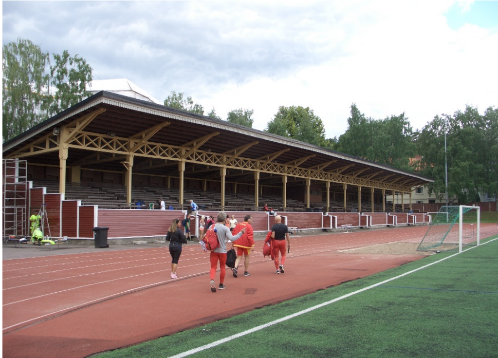
Estadi vell de Tampere (anella de 350 metres i graderia totalment de fusta).