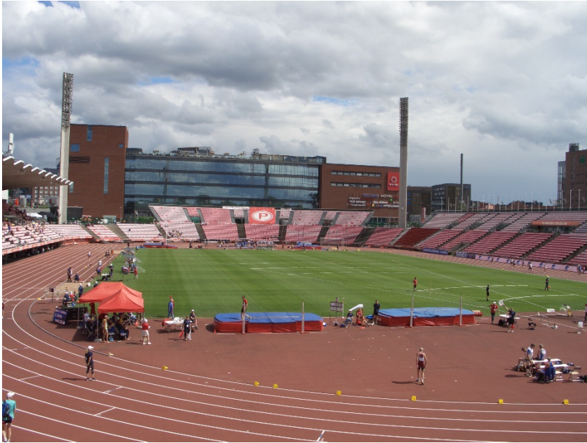
Estadi (al fons i a dalt de tot, terrassa panoràmica de l'espectacular "Periscope").