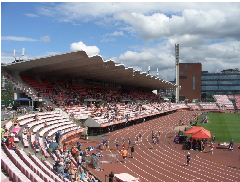
Estadi (al fons, centre comercial Ratina, motiu pel qual també l'Estadi és conegut així).