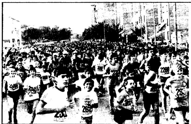
El Marató Popular movilizó a miles de atletas y aficionados al «footing».