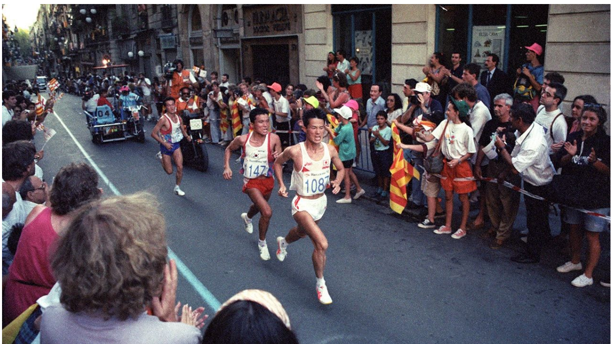
Pas pel centre de la ciutat. Barcelona 92.