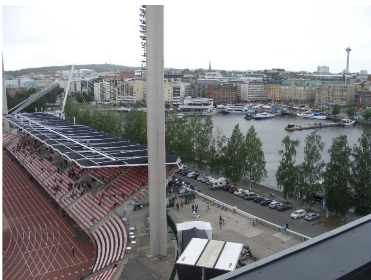
Vista panoràmica des de el "Periscope" (al fons, Torre de Särkäuniemi).