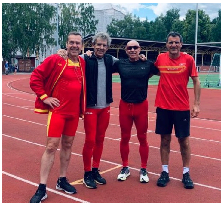
Equip nacional del relleu 4x100 M60 després d'un assaig de canvis a l'Estadi vell.