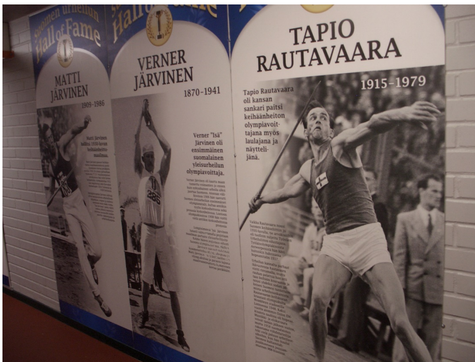
Estadi de Tampere (quadres en honor als millors esportistes finlandesos).

no era factible. Personalment, em va fer molta il·lusió córrer en la mateixa pista (tot i que llavors era de cendra) que el mític Nurmi havia fet un rècord mundial. Per cert, i parlant de Nurmi, un dels dies ens vàrem acostar fins a Turku, ciutat natal de l'històric atleta, i que hi ha una estàtua en el seu honor en una de les principals avingudes de la ciutat, precisament, la que es dirigeix a l'Estadi (un altra estàtua molt similar a aquesta, es troba davant l'Estadi Olímpic de Hèlsinki). Doncs bé, passejant per un parc de la ciutat, ens varen trobar mitja pista de material sintètic (imaginar-se com si fos un tros des de la sortida dels 150 metres), de 4 carrils i equipat amb startings i tanques atlètiques, tot ben col·locat. Era a l'aire lliure, obert al públic, ningú vigilant... i el material allà. Aquí, amb els "xatarreros" que hi ha, ja hagués volat ¡¡¡