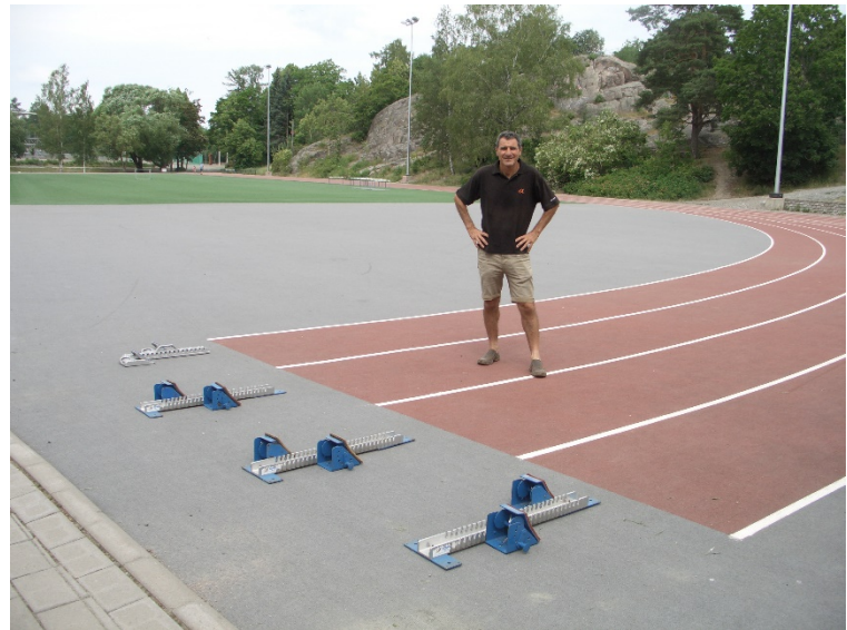
Material d'entrenament (startings i tanques) en una mitja pista (sintètic) en un parc.