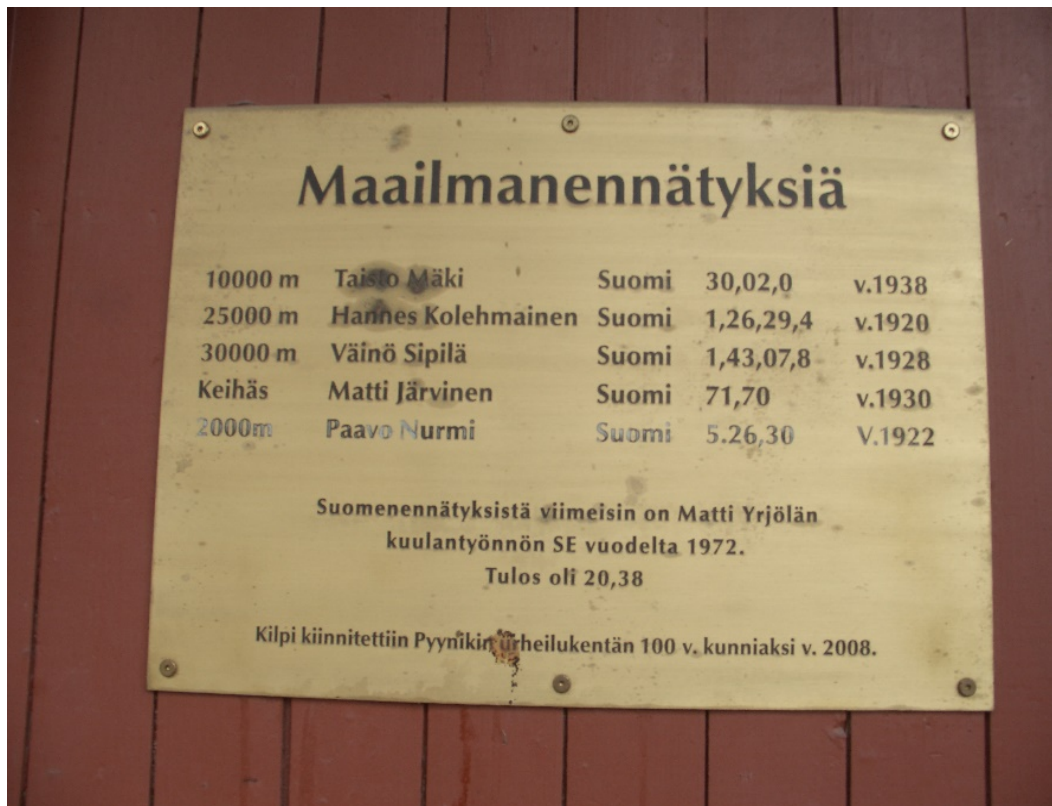
Placa commemorativa als 5 rècords del món batuts en el vell Estadi de Tampere.